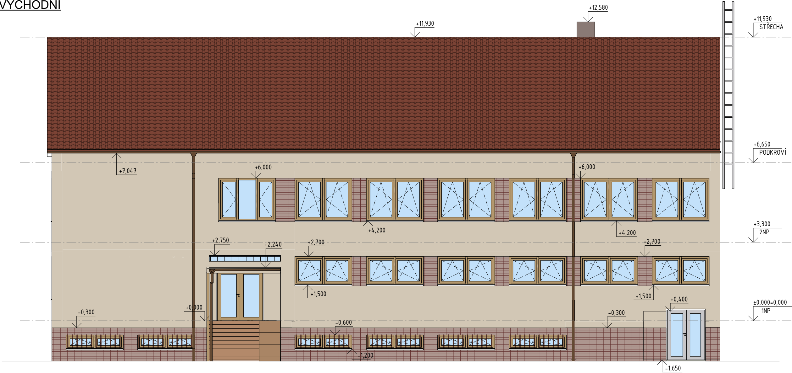
POHLED JIHOVÝCHODNÍ MĚŘÍTKO 1 : 100