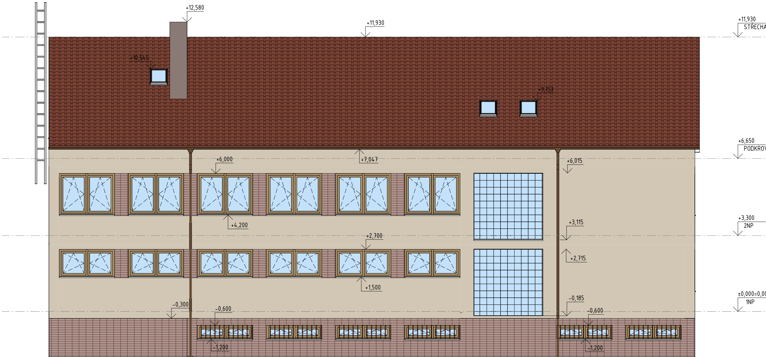
POHLED SEVEROZÁPADNÍ MĚŘÍTKO 1 : 100